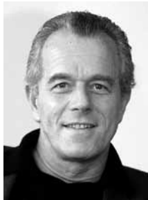
Hans Kollhoff Professor für Architektur und Konstruktion, ETH Zürich

Die vier geplanten Hochhäuser führen zu einer weithin sichtbaren Verschandelung des Stadtbildes und des Seeufers. Darunter leiden unmittelbar Hunderte von Einwohnern in den Quartieren, die sich vehement gegen den Bau dieser Fremdkörper wehren. Langfristig ist zudem eine irreparable Schädigung des Tourismus und der damit zusammenhängenden Wirtschaftsfaktoren zu erwarten. Dies legt eine vor kurzem durchgeführte Gästebefragung von «Schweiz Tourismus» nahe, welche als wichtigsten Anziehungsfaktor des Standorts Luzern das reizvolle Stadtbild, eingebettet zwischen See und Bergen, ergeben hat.